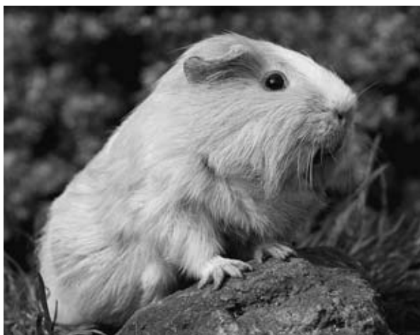
Kecker Blick in freier Natur – Meerschweinchen lieben Auslauf

Viele Menschen fühlen sich der Natur verbunden und möchten gerne ein Haustier halten. Oft sind es gerade Kinder, die sich ein Tier wünschen und große Freude an dem neuen „Hausgenossen“ haben. Doch vor der Anschaffung eines Haustieres sollte man sich darüber im Klaren sein, dass man Kindern allein nicht die volle Verantwortung für ein Tier übergeben kann. Sie können in die Pflege miteinbezogen werden. Ein Tier in die Familie aufzunehmen, ist aber nur dann sinnvoll, wenn auch ein Elternteil Freude an dem Tier hat. Meerschweinchen gelten vielfach als ideale Tiere für Stadtwohnungen. Sie sind ruhig und stören die Nachbarn nicht. Als „Kleintiere“ dürfen sie außerdem grundsätzlich auch ohne Erlaubnis des Vermieters gehalten werden. Durch ihre Lebhaftigkeit bereiten sie Kindern und Erwachsenen viel Freude. Aber auch ein Meerschweinchen ist ein Lebewesen, das arteneigene Be-