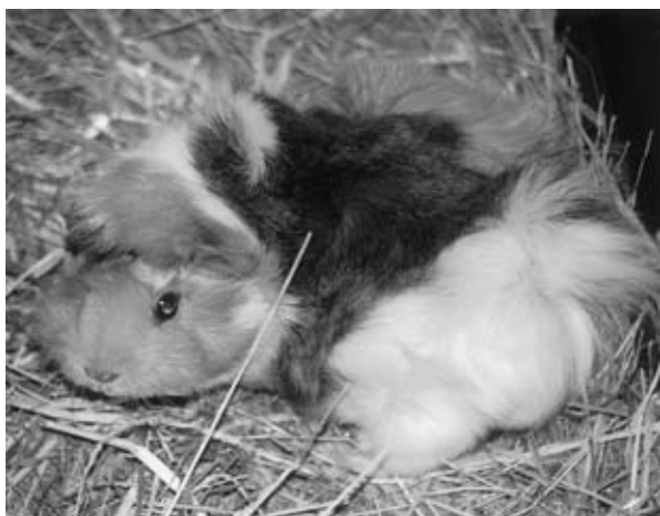
Meerschweinchen lieben Stroh – zum Knabbern und Hineinkuscheln

Meerschweinchen können kein Vitamin C bilden. Sie müssen abwechslungsreich ernährt werden, damit keine Mangelkrankheiten auftreten. Die Vitamin C-Versorgung kann in Notfällen auch durch Tropfen über das Trinkwasser gewährleistet werden, dies ist jedoch nur bei kranken Tieren nötig oder