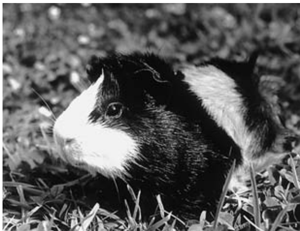
Neugieriges Meerschweinchen erkundet seine Umgebung

Aus diesem Grund sollte das Gewicht einmal wöchentlich kontrolliert werden, um Gewichtsschwankungen frühzeitig festzustellen.