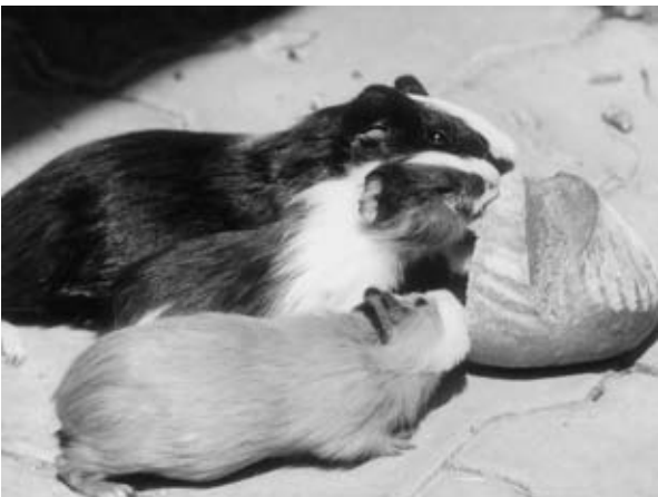
Als Jungtiere gewöhnen sie sich am leichtesten aneinander

Im Allgemeinen kann man jüngere Meerschweinchen gut älteren Tieren zugesellen. Meerschweinchen sind bewegungsaktive Tiere. Sie laufen gern, genießen die Sicht von erhöhten Plätzen und richten sich auch gern einmal auf. Die konventionelle Käfighaltung ist nicht artgerecht. Für zwei